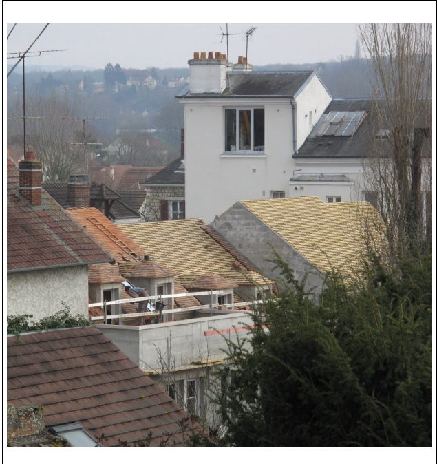
Logements sociaux rue Frédéric Fabre Bel exemple de densification des constructions après modification du COS.

* Rappel : (particulièrement destiné aux conseillers municipaux socialistes) le mot GHETTO signifie lieu où une minorité se trouve regroupée et isolée du reste de la population.